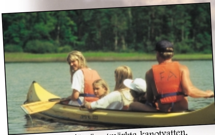
Rolstorpssjön är utmärkta kanotvatten. Ett par bra platser runt sjön ger möjlighet för en övernattnig med mindre grupper.