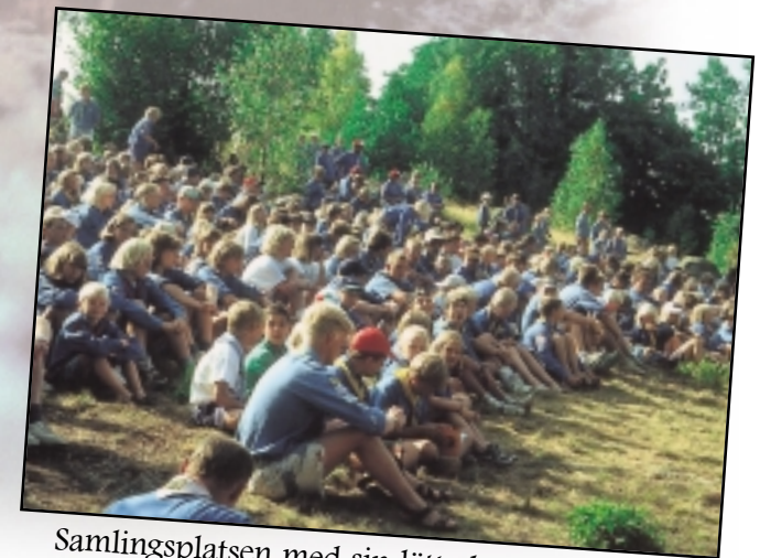
Samlingsplatsen med sin lätta lutning ger alla åskådare, ung som gammal möjlighet att se vad som händer och sker.