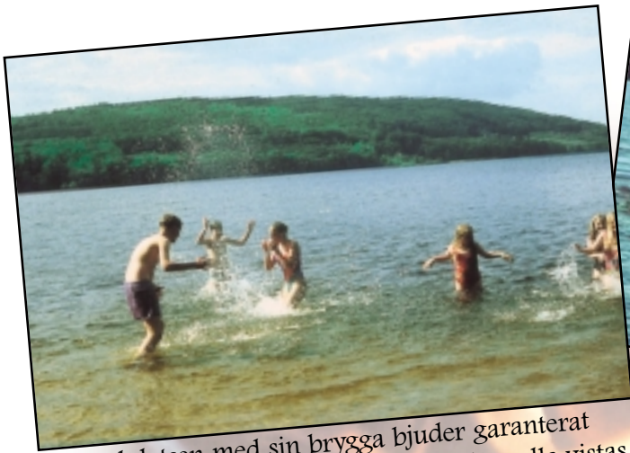
Badplatsen med sin brygga bjuder garanterat på svalka under heta lägerdagar. Här kan alla vistas, även deltagare med rörelsehinder.