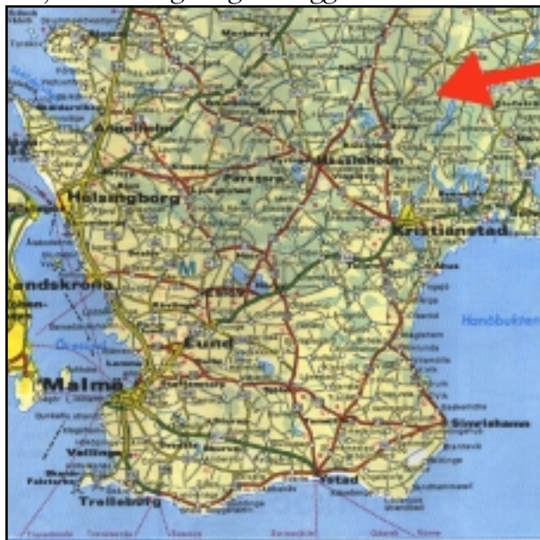
Skiss över lägerområdet

Här, mitt i Göingeskogarna ligger Hultet.