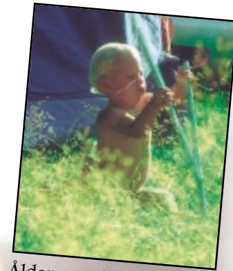
Åldern spelar inte så stor roll på Hultet. Här finns plats för allas intressen...