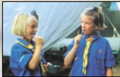
Lägerhygienen är viktig, bra placerade vattenposter gör det enkelt att hämta dricksvatten till nödvändigheter.